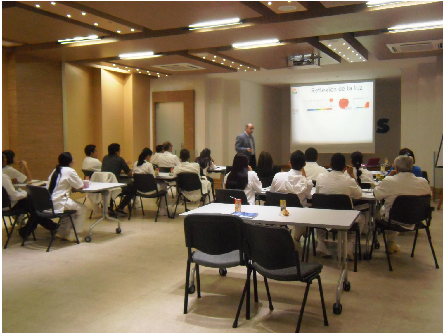
Jornada Técnica TECNAS S.A . (Medellin, Colombia). Enero 2012