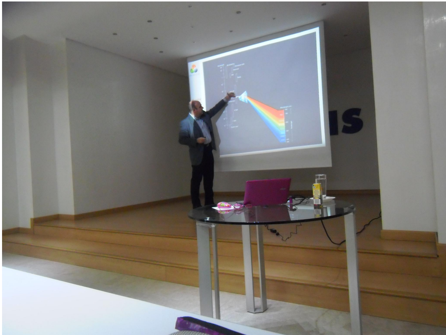
Jornada Técnica TECNAS S.A. (Medellin, Colombia). Enero 2012