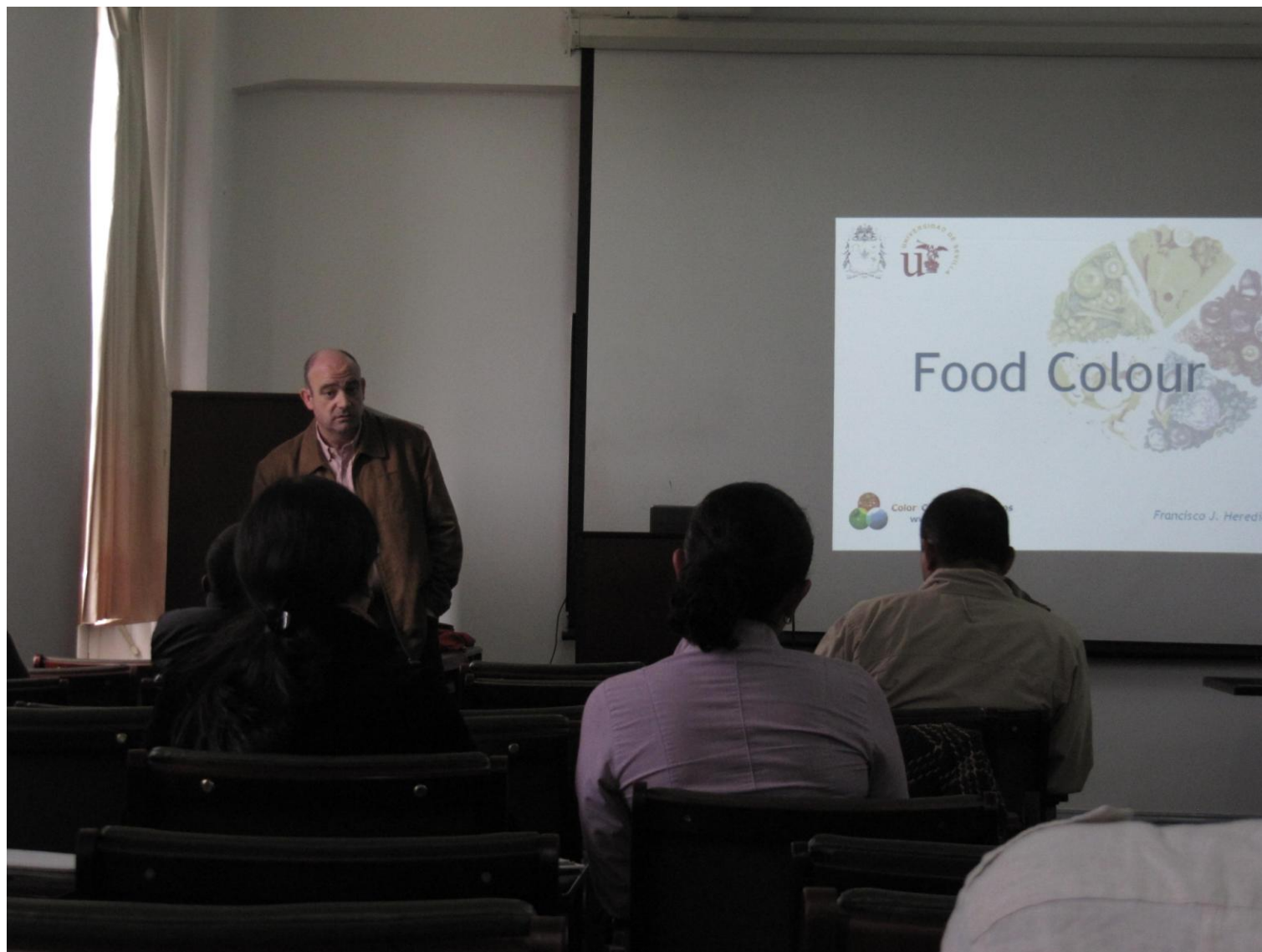
Seminario técnico sobre color y análisis de imagen y sus aplicaciones industriales en la UNAL (Bogotá, Colombia). Enero 2012.