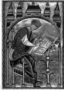
Scriptorium Isidori Hispalensis