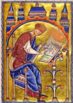
Scriptorium Isidori Hispalensis

DIRECCIÓN GENERAL DE FORMACION CONTINUA Y COMPLEMENTARIA AULA DE LA EXPERIENCIA