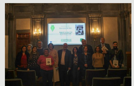
Los coordinadores del libro junto con los autores de los capítulos asistentes al acto.

Esta mirada al periodismo local sevillano puede tomarse como un acercamiento a mostrar la falta de medios y periodistas que apuesten por lo local, por un periodismo que vuelva a contar con la credibilidad, que sea real y veraz. Sin estos espacios locales, ¿quién le cuenta al pueblo lo que allí ocurre?, ¿a qué noticias deberían prestarle atención?