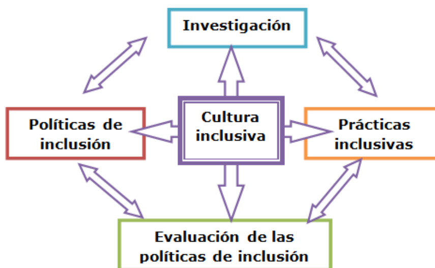
Figura 2. Modelo Explicativo de la interrelación entre Investigación, Políticas, Evaluación y Practicas Inclusivas.

La evaluación, está por tanto estrechamente conectada con la investigación, nutriéndose por un lado de las herramientas metodológicas, y ayudando a construir marcos conceptuales explicativos. La Figura 2, muestra cómo se incorpora la evaluación al flujo anteriormente descrito.