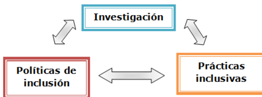
Figura 1. Flujo entre Investigación, Políticas y Prácticas inclusivas

La Figura 1 que exponemos a continuación permite visualizar la interrelación entre investigación, políticas de inclusión y prácticas inclusivas.