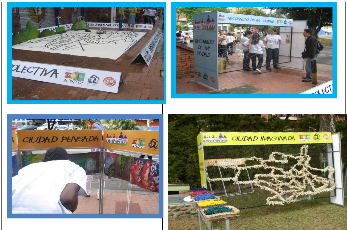
Fig. No. 7. Momentos de la evaluación en género y ciudadanía.

El proyecto de investigación se desarrolla con profesorado de infantil y la recolección de la información previa sobre las manifestaciones, la participación y la sensibilización sobre género y ciudadanía se realiza a partir un juego. Estas técnicas colocan las concepciones del profesorado relación con la ciudadanía como una de las principales herramientas para la búsqueda de alternativas para la construcción de una ciudadanía paritaria. El juego permite hacer énfasis en: El conocimiento de la ciudad, Las interacciones que ocurren en ella, las problemáticas que tiene la ciudad sobre participación y género y la ciudad que se desea tener.