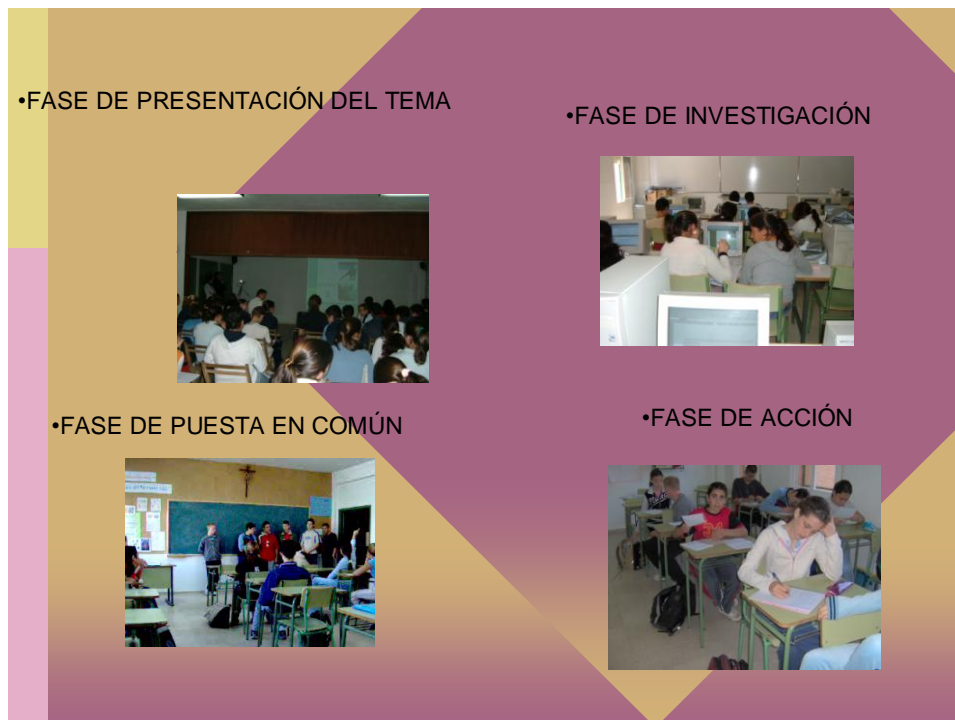
Fig. 3. Metodología didáctica desarrollada mediante la Webquest.

La metodología que se desarrolla en clase consta de las fases descritas en la figura 3.