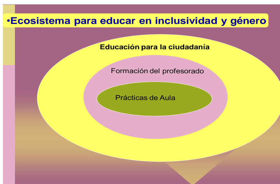
Figura 2. Ecosistema para abordar la formación en género.

Otro aspecto importante a tener en cuenta son los ámbitos que serían objeto de una formación inclusiva en género. En este sentido la figura 2 relaciona los espacios formativos que deben considerarse en una educación inclusiva de género.