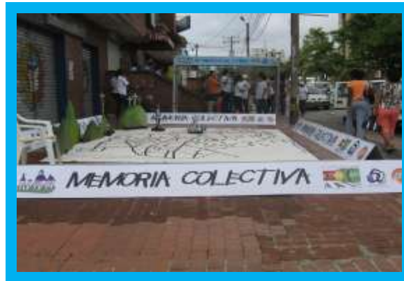
Imagen No.1. Juego “Memoria Colectiva”

Descripción. Tiene como objetivo reconstruir formas de habitar la ciudad. Consistió en dibujar en un lienzo el plano de la Ciudad de Santiago de Cali, con el trazado de sus calles principales, para que los participantes tuvieran la oportunidad de interactuar ubicando en el mapa alguno de los lugares representativos de nuestra ciudad, mediante fotografías impresas en tela sintética: se pretende el reconocimiento de lugares e iconos de la ciudad y las formas de interacción en los mismos.