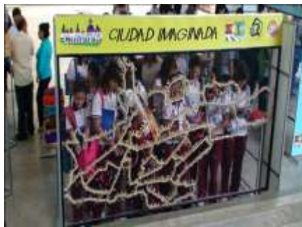
Imagen No.3. Juego “Ciudad Imaginada”

Se busca establecer un compromiso de los espectadores en la construcción de la ciudad de futuro. Esta actividad propone tejer con tiras de colores en el mapa de la ciudad de Santiago de Cali, (comunales, de la parte urbana) representado en una malla plástica y en un esquema de alambro, los compromisos de los participantes en relación con la ciudad que sueñan habitar.