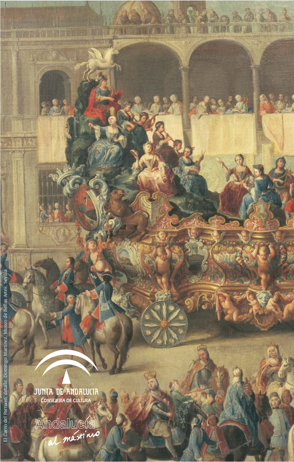
El Carro del Parrnaso, detalle. Domingo Martínez. Museo de Bellas Artes, Sevilla