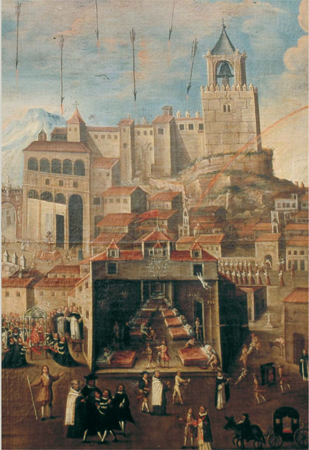
La Epidemia de peste, detalle. Anónimo. Iglesia de Santo Domingo, Antequera