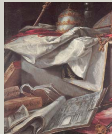
In Ictu Oculi, detalle. Juan de Valdés Leal. Iglesia del Hospital de la Caridad, Sevilla

CONGRESO INTERNACIONAL ANDALUCÍA BARROCA