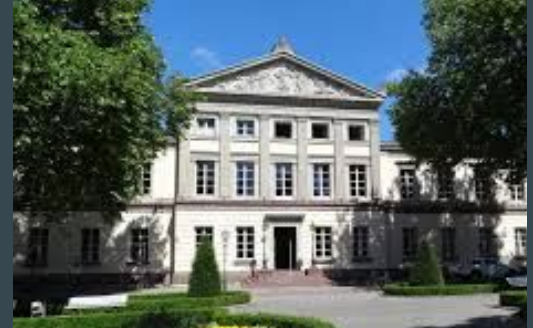
Universidad de Gottingen