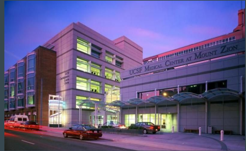
Hospital Mount Zion en la actualidad