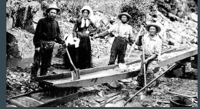
Fiebre del oro en California