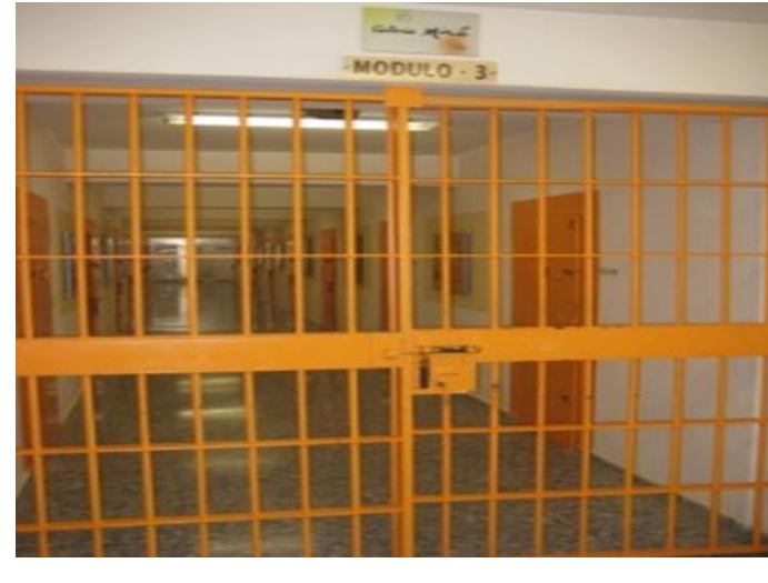
Psicodrama Metodología de acción