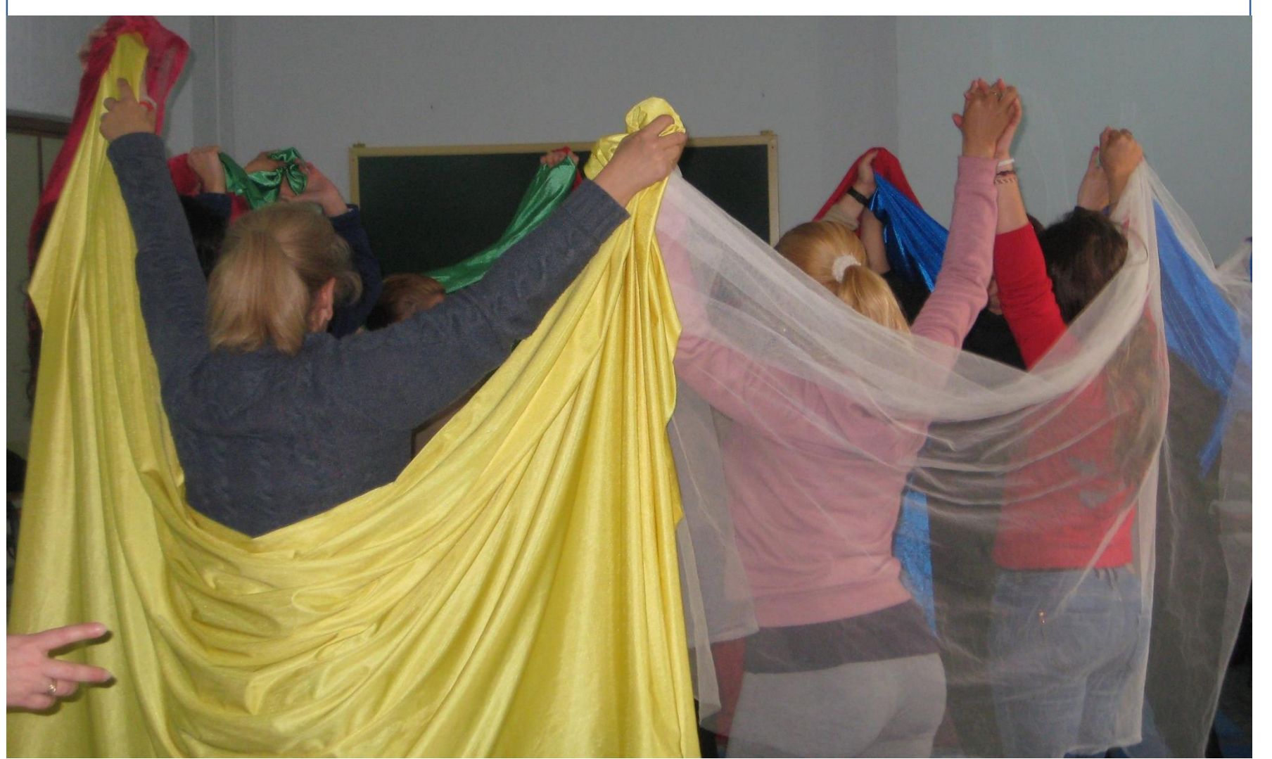
Figure 2. Psicodanza: ¿Qué significa la sororidad en la cárcel?

Comienzo del desarrollo y registro de las 10 sesiones principales de intervención con la temática específica de Psicodrama y empoderamiento. (momento actual)