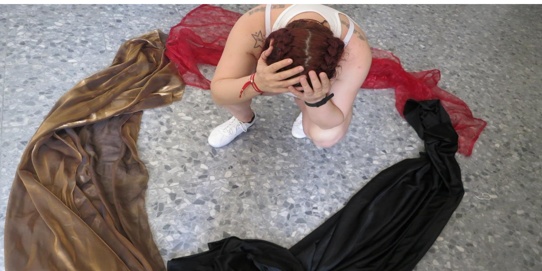
Figure 1. Imagen psicodramática creada por una participante para explicar el grado de aislamiento que tenía dentro de su relación de pareja donde fue víctima de malos tratos. "Pensaba que nunca iba a poder salir de allí"