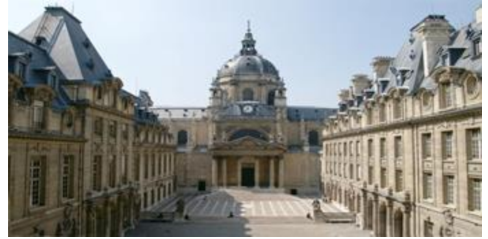
Universidad la Sorbona de París