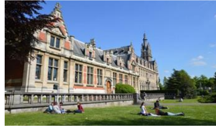
Universidad de Bruselas