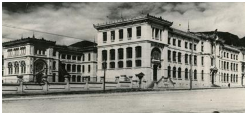
Museo Pedagógico Nacional de Madrid