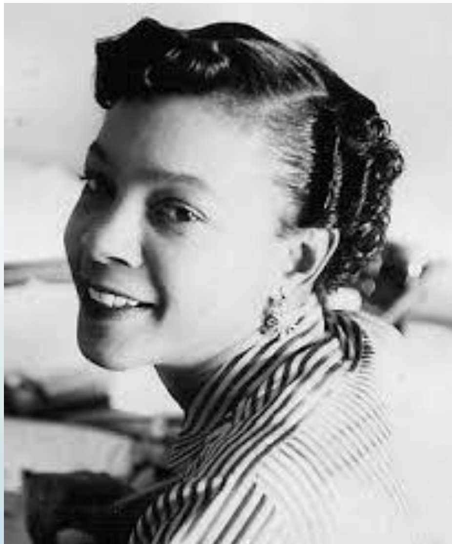
MAMIE PHIPPS CLARK