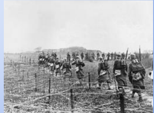
Ejército canadiense, 1915