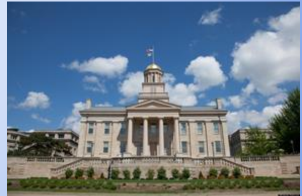
Universidad de Iowa