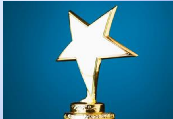
Premio Janet Taylor Spence