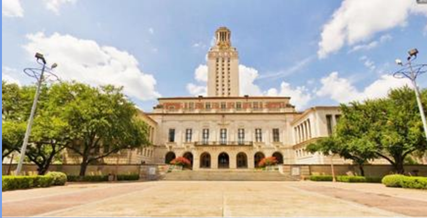
Universidad de texas