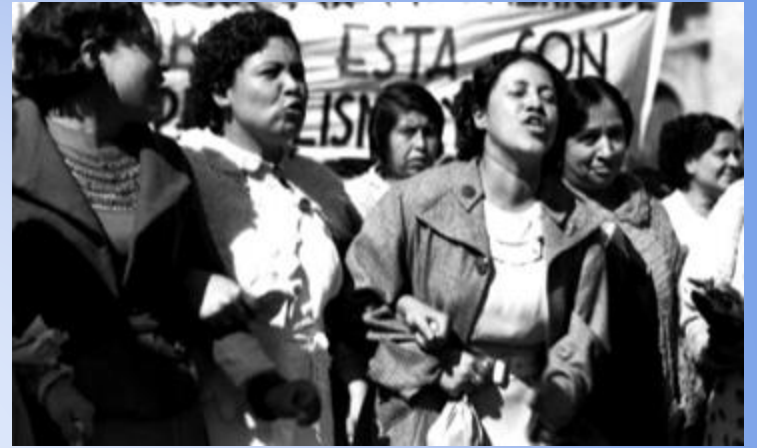
Liga de las mujeres votantes