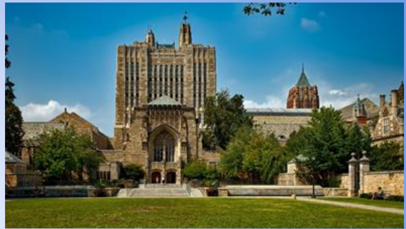
Universidad de Yale