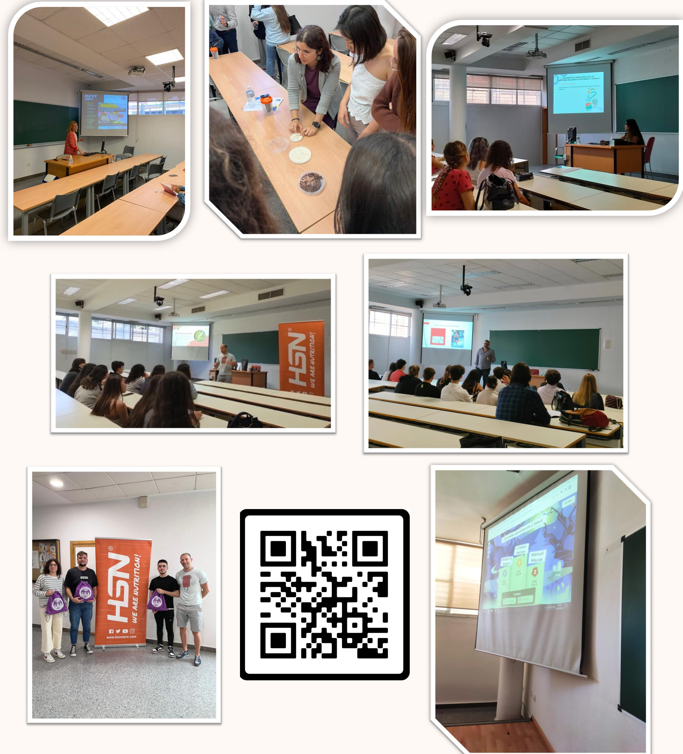
Fig. 1. Fotos de las distintas sesiones, ganadores de los kahoot , y QR de la encuesta final realizada a los alumnos.

Hemos hecho uso de las redes sociales para la difusión de las Jornadas, tanto las de la Universidad de Sevilla como las propias del grupo (Fig. 2).