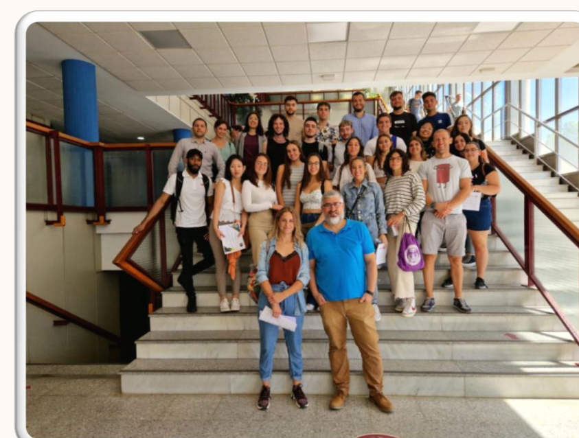
Fig.3. Grupo asistente del día 14/010/2022