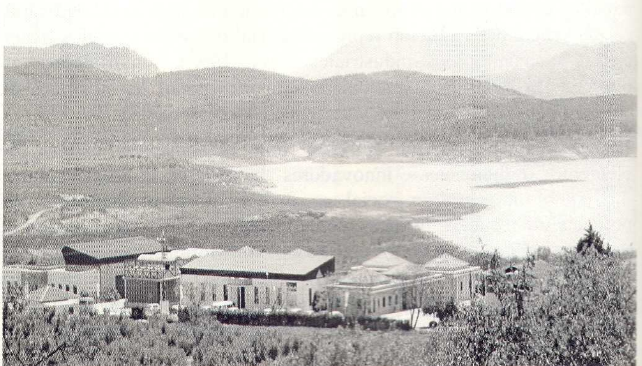
Imagen 1. Vista del Consorcio de Guadalteba (Málaga).

La comarca de la Sierra de Cádiz nos sirve como ejemplo de la puesta en funcionamiento de dicho capital social a la hora de introducir sistemas de calidad certificada. El GDR Sierra de Cádiz ha sido el instrumento institucional elegido para fomentar el uso de