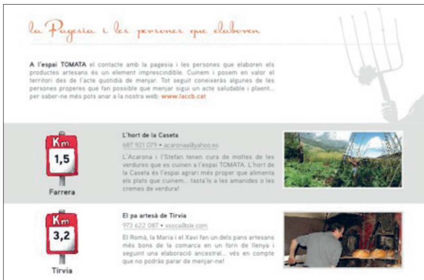
Imagen 4. Hoja del libro-menú.

Estos materiales se han podido elaborar, en parte, gracias a una ayuda del Parque Natural de l'Alt Pirineu , para proyectos de educación ambiental y divulgación de los valores naturales y culturales del Parque Natural. Esta es otra innovación de Espai Tomata , que busca aliados también en la administración pública para comunicar su mensaje y darse a conocer. La creación de redes entre los agentes y actores locales supone una fuerte herramienta que contribuye a aumentar la sinergia y la coherencia territorial, dos elementos imprescindibles para alcanzar la cohesión interna y externa del territorio.