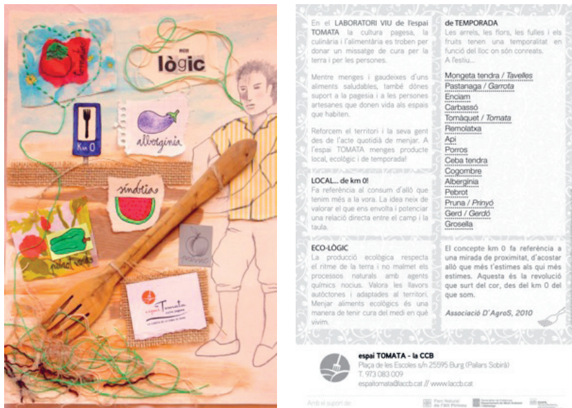
Imagen 2. Tarjeta divulgativa de Espai Tomata .

tramos ni tomates ni lechuga hasta que el calor permite su maduración. Este planteamiento supone una defensa desde la práctica de dos consabidas pero olvidadas tríadas: agricultura-medioambiente-territorio y agricultura-salud-nutrición.