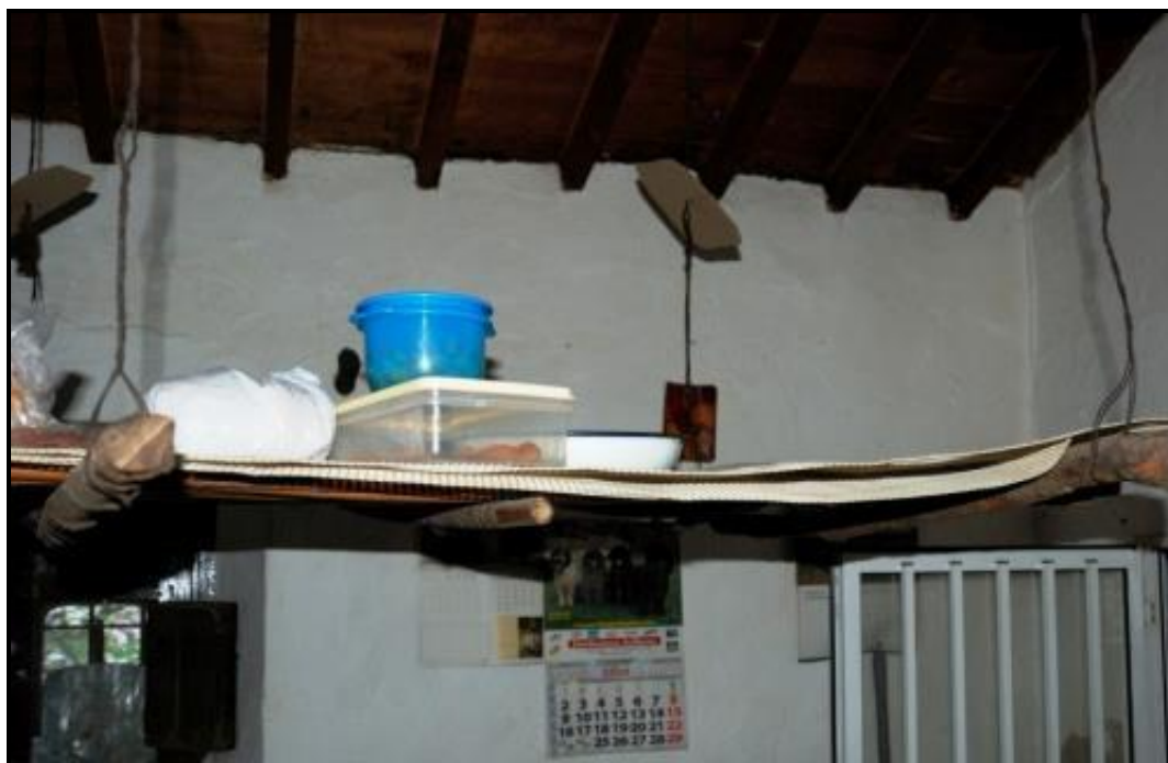
Figura 6: Un zarzo todavía en uso en un chozo.