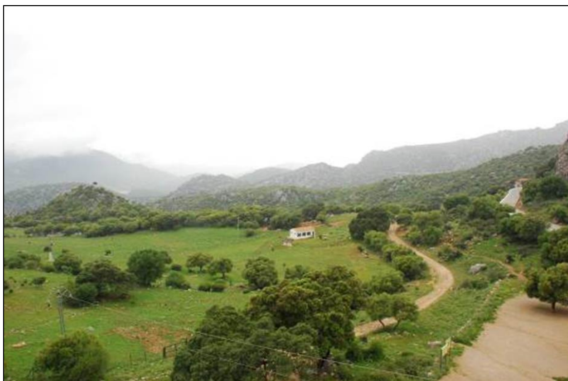
Figura 3: Vista de finca ganadera en la sierra alta.