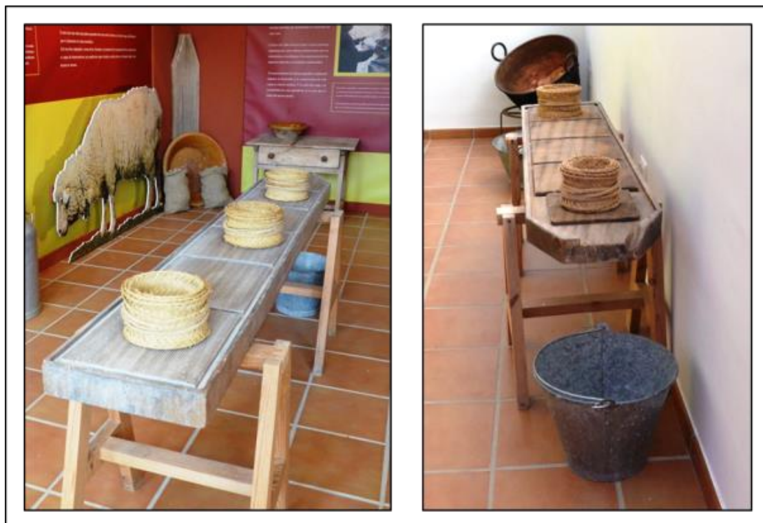
Figura 5: Representación de sistema tradicional en el Museo del Queso de Villaluenga.