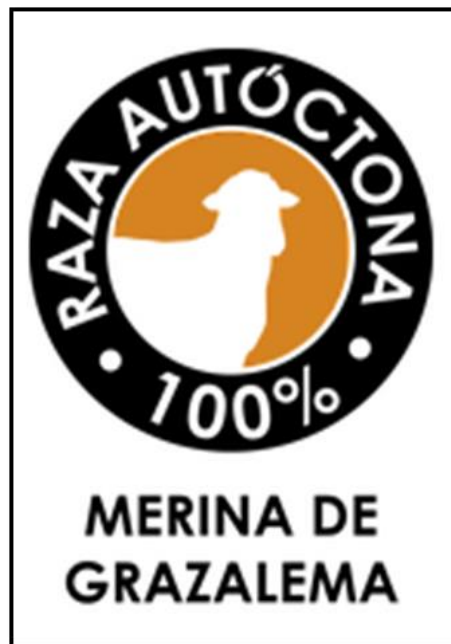
Figura 4: Logo certificador de 100% producto de Merina de Grazalema.