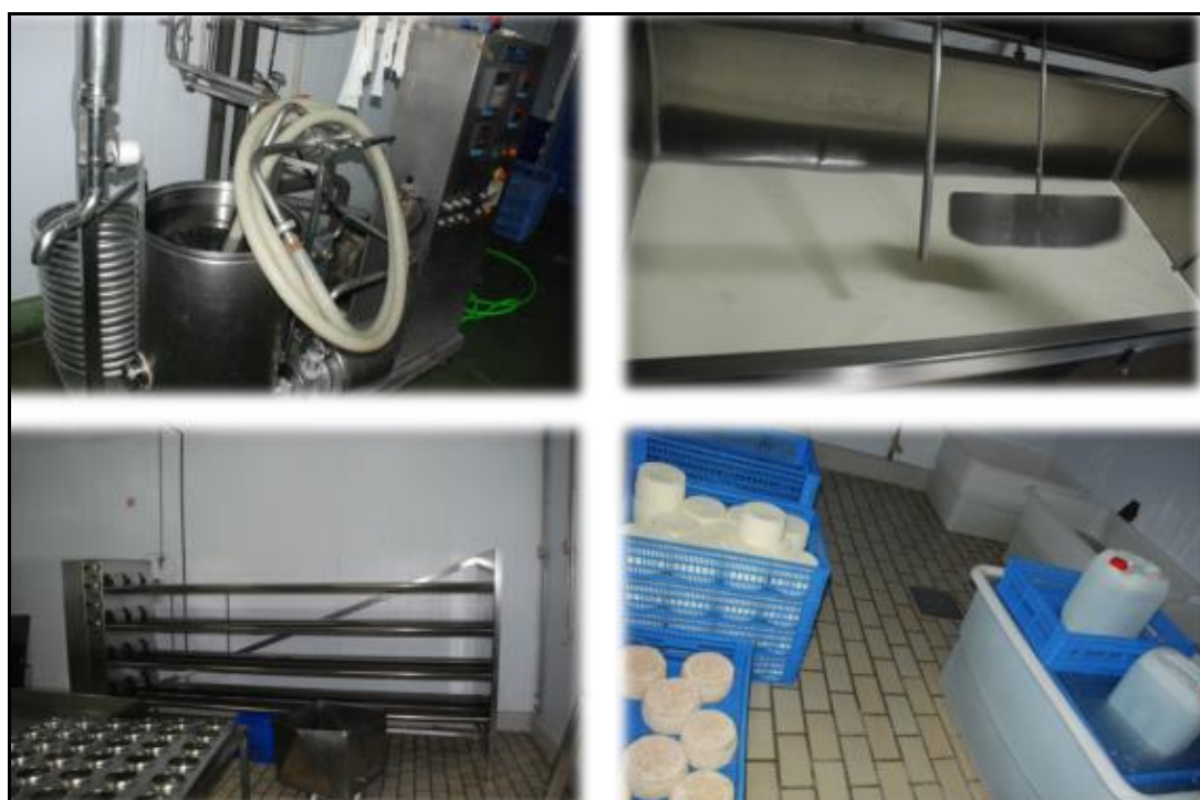
Figura 7: Maquinaria e instalaciones de quesería industrial en Villaluenga.