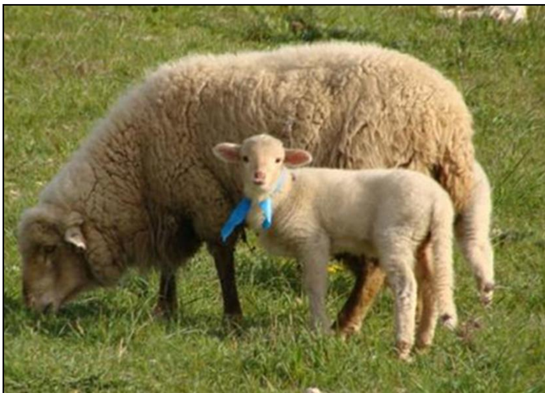
Figura 2: Oveja adulta y cordero lechal de la raza merina de Grazalema.