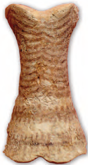
Ídolo falange hallado en las excavaciones de la Avenida de Andalucía nº 9 (Valencina de la Concepción, Sevilla).